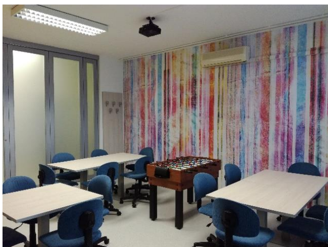
Slika: Prenovljena učilnica

Center za družine Harmonija ima novo podobo!