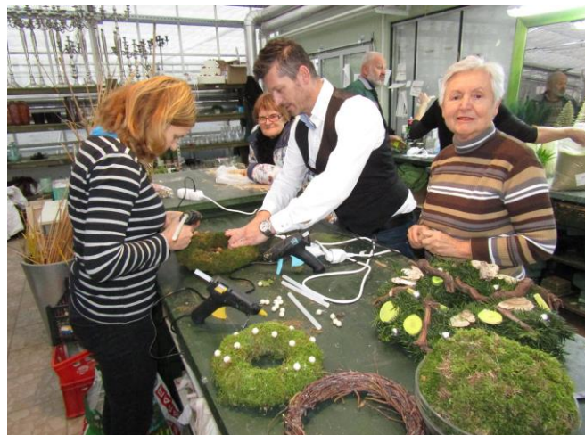
Slika 2: Izdelava adventnih venčkov krožka Rastline naredijo dom lepši