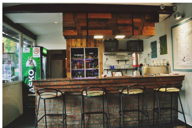
Slika 7: Prenovljen gostilniški pult