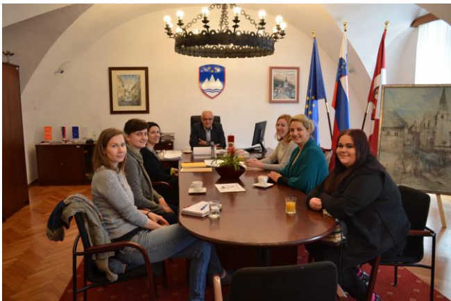
Slika 3: Sestanek na Občini Vitanje.

Promocijo mladih arhitektov in arhitekt ter projektov naročnikov se zagotavlja s kvalitetno zasnovanim medijskim in informacijskim načrtom.