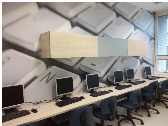
Slika: Prenovljena računalniška učilnica.

Vabljeni, da si nove prostore pridete ogledat na lastne oči!