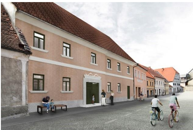
Slika 4: Vizualizacija predvidene prenove trške hiše v Vitanju – Vitan'ka.

Mladi, ki so vključeni v kreativno skupnost aktivno sodelujejo pri reševanju prostorskih vprašanj. Sodelovali so tudi pri načrtovanju prenove prireditvenega centra Patriot , ki se nahaja v spodnjih prostorih MCDD. V prenovljenih prostorih se izvajajo neformalne izobraževalne vsebine. Mentorji v 3D delavnici in co-working prostoru mlade učijo rokovanja s 3D tehnologijo, v sklopu drugega projekta, pa se izvajajo vinske degustacije in pokušine lokalnih mesnih in mlečnih proizvodov.