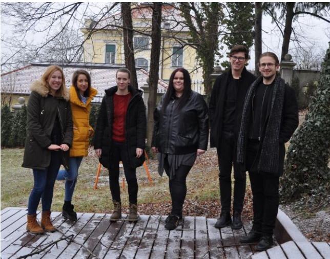
Slika 1: Mladi s področja arhitekture, krajinske arhitekture in grafičnega oblikovanja.

Junija 2016 je Mladinski center Dravinjske doline (MCDD) v Slovenskih Konjicah začel izvajati projekt Mladinske kreativne produkcije (MKP) . Projekt MKP traja do septembra 2018 in združuje perspektivne mlade iz različnih področij kreativne industrije, predvsem arhitekture in oblikovanje in tudi elektro-gradbenega sektorja . Naložbo sofinancirata Republika Slovenija in Evropska unija iz Evropskega socialnega sklada.