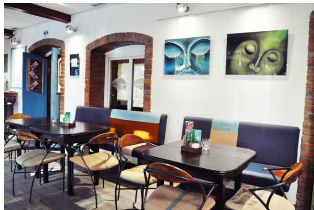
Slika 6: Razstavni prostor