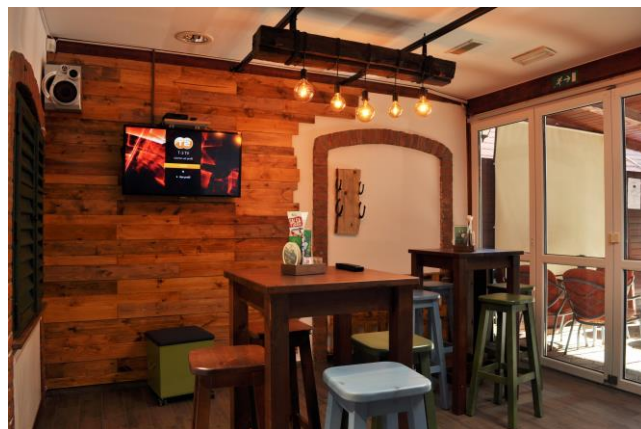
Slika 5: Vinski butik v prostorih Patriota za degustiranje lokalnega vina.

Mladi, ki so vključeni v kreativno skupnost aktivno sodelujejo pri reševanju prostorskih vprašanj. Sodelovali so tudi pri načrtovanju prenove prireditvenega centra Patriot , ki se nahaja v spodnjih prostorih MCDD. V prenovljenih prostorih se izvajajo neformalne izobraževalne vsebine. Mentorji v 3D delavnici in co-working prostoru mlade učijo rokovanja s 3D tehnologijo, v sklopu drugega projekta, pa se izvajajo vinske degustacije in pokušine lokalnih mesnih in mlečnih proizvodov.