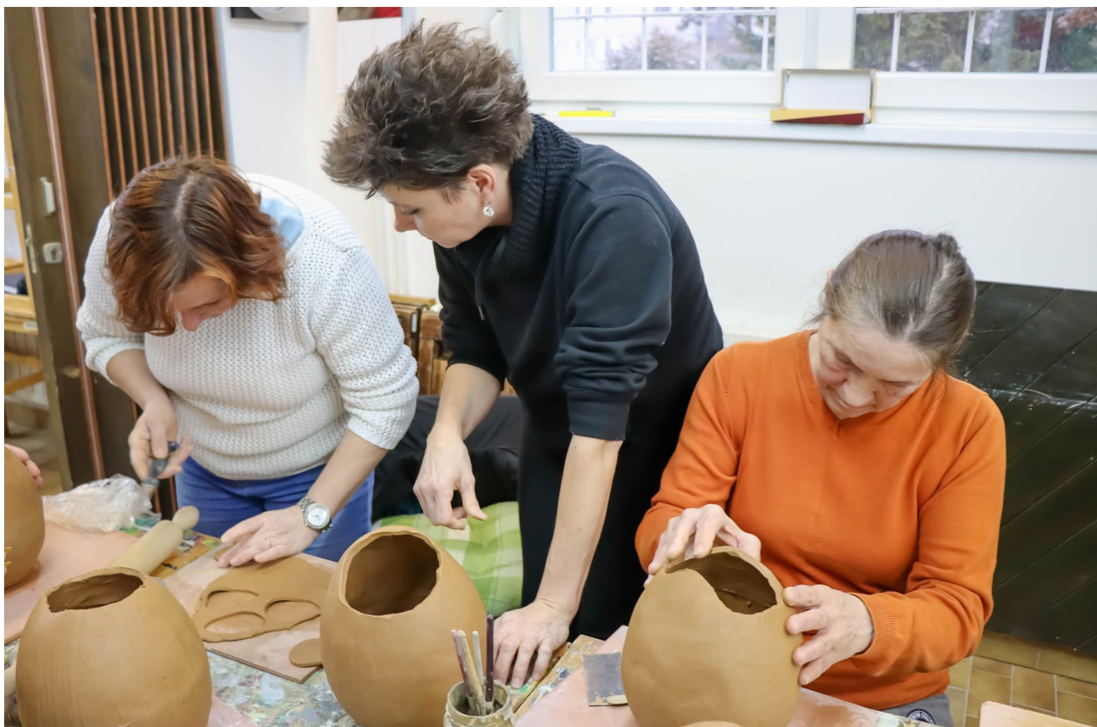
Ustvarjalnica izdelovanja glinenih izdelkov je imela posebno noto – spoznavali smo celoten proces izdelovanja iz gline