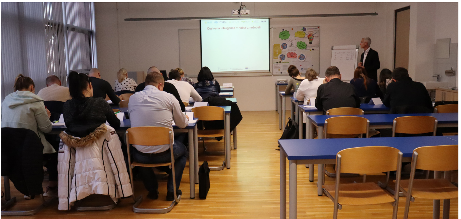
PROJEKT SPIN: Usposabljanje na temo čustvene inteligence, Velenje 2020