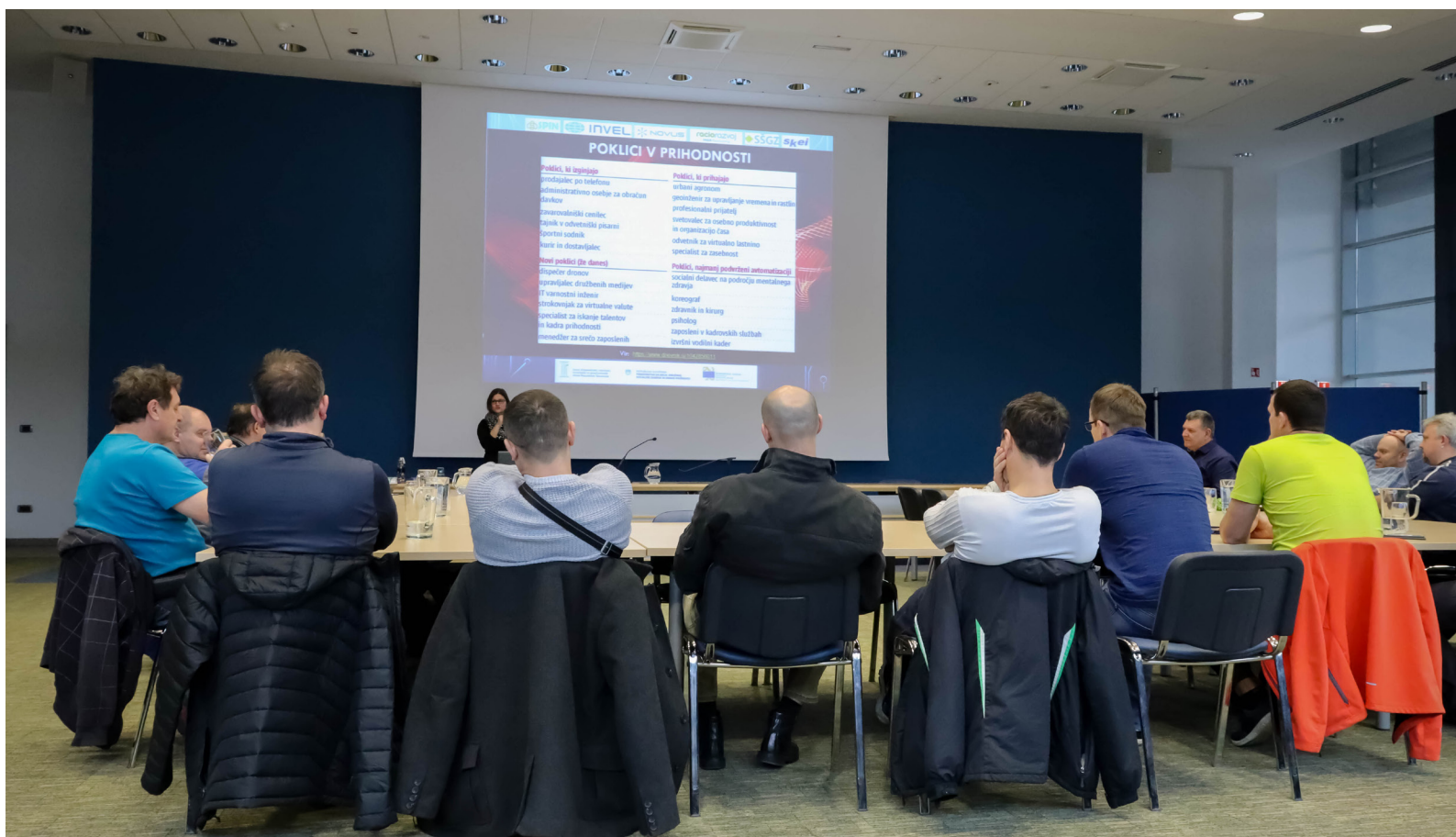
PROJEKT SPIN: Motivacijska delavnica, Teš 2020

Večina dnevnih aktivnosti, ki smo jih lahko pred tem opravljali v živo na terenu se je preselila na online komunikacijo, ki je čez noč postala nujnost in ne le opcija. Tako smo tudi v projektu SPIN-KRVS številne sestanke in aktivnosti preselili v razne e-oblike komunikacije. Skype in Zoom sta postala čez noč naš vsakdan.