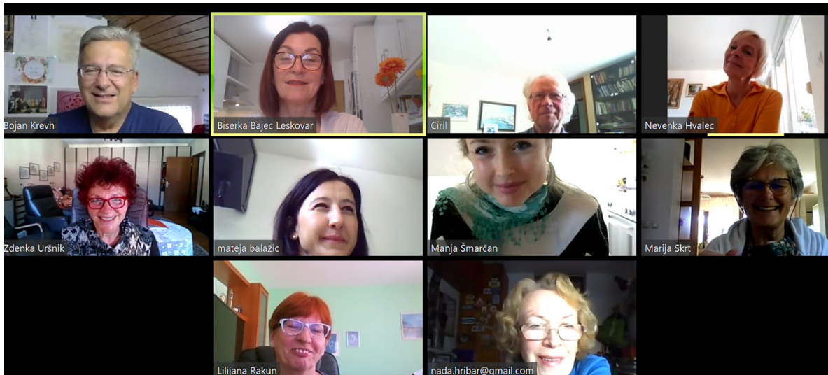
Preko ZOOM-a bomo izpeljali sejo UO v torek, 5.maja 2020.