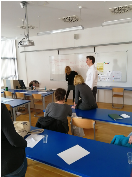
Strokovna predavanja na področju psihologije

Aktivnosti potekajo zelo raznoliko – od strokovnih predavanj, ustvarjalnih delavnic, praktičnih pridobivanj znanj na področju računalništva in ter iskanja zaposlitvenih možnosti na spletnih portalih.