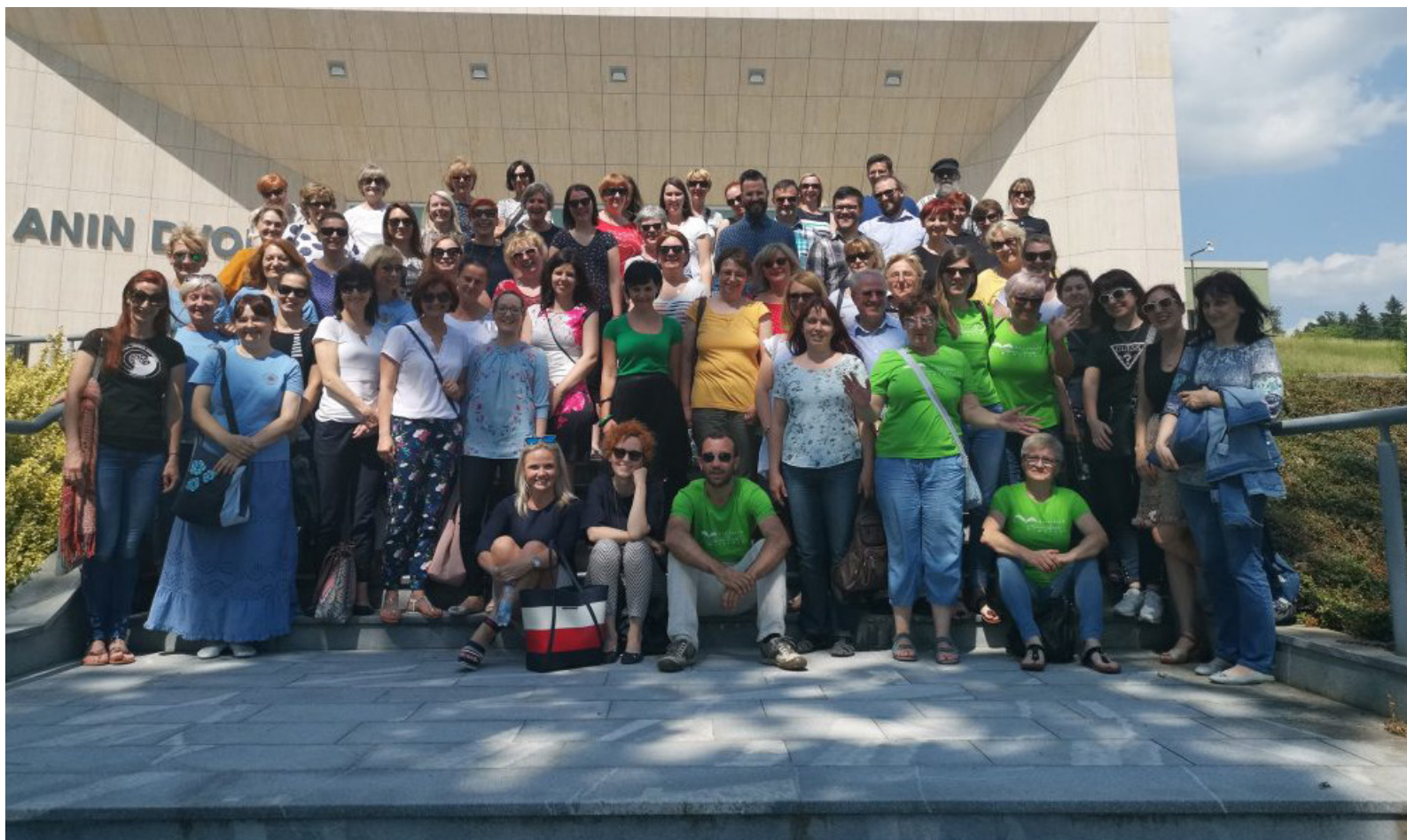
Fotografija članov DBC iz lanskoletnega srečanja v organizaciji Knjižnice Rogaška Slatina.