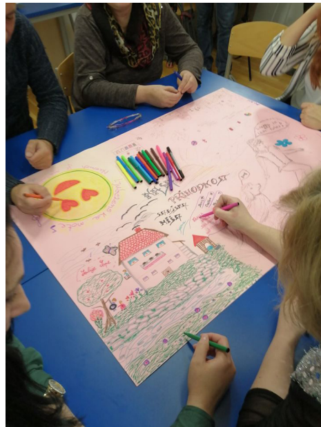
Ustvarjalnica izdelovanja glinenih izdelkov je imela posebno noto – spoznavali smo celoten proces izdelovanja iz gline.

V drugem modulu se bodo izvajale aktivnosti usmerjene za spoznavanje trga dela, dvig funkcionalnih kompetenc in kompetenc za približevanju trga dela ter pridobivanje praktičnih izkušenj za trg dela.