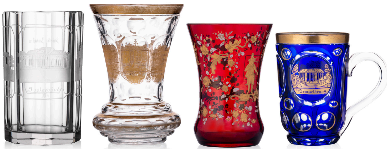
Zgodovinski kozarci o Rogaški Slatini, iz zbirke LMRS, foto Iztok Nikolič

Knjiga je nastajala vso leto 2019, v februarju je šla v tisk v Tiskarno Gracer v Celju in predstavitev je bila planirana v začetku aprila na Gradu Podsreda ob občinskem prazniku Občine Kozje (društvo je bilo ustanovljeno v Kozjem in ima tam domicil).