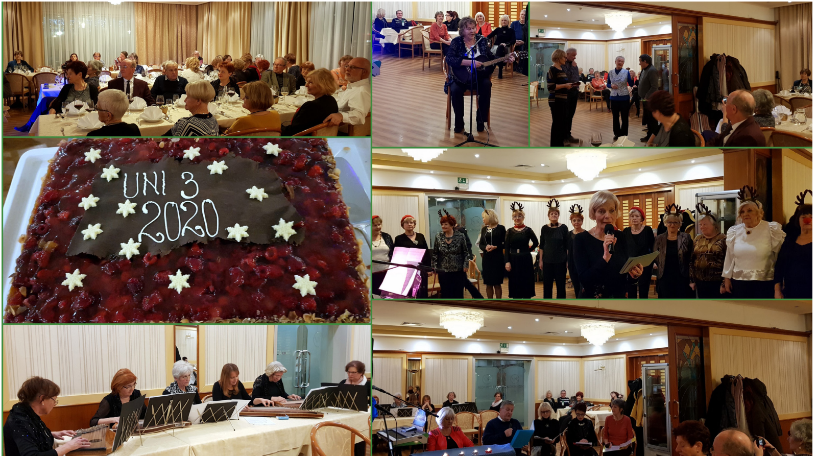
V knjižnici Velenje so v petek 31.01.2020. nastopile Citrarke Marjanke na Marjanovem večeru.